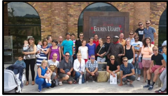
Wizards, amis Espagnols, et un Victorino en bronze au vignoble.

Au jour le jour, les entrainements passent un après l'autre et les jours se suivent et se ressemblent. Course ou vélo, natation, suivit par une course (ou un vélo) plus intense. Cela fait maintenant près d'un mois que nous suivons la routine, et juin s'est écoulé sans bruit, ce qui n'est pas trop intéressant pour vous. Croyez-le ou non, parfois un peu de répétition, c'est tout ce que je désire comme athlète. Ceci dit, il y eu tout de même quelques événements marquants en juin 2014, que je vous présente dans une liste non-exhaustive, et non-chronologique.