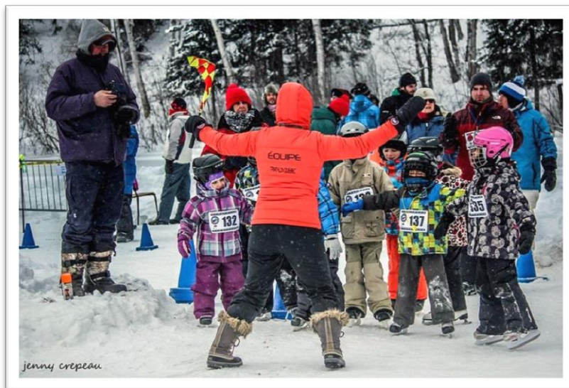
Échauffement au départ des enfants – Chute St Philippe