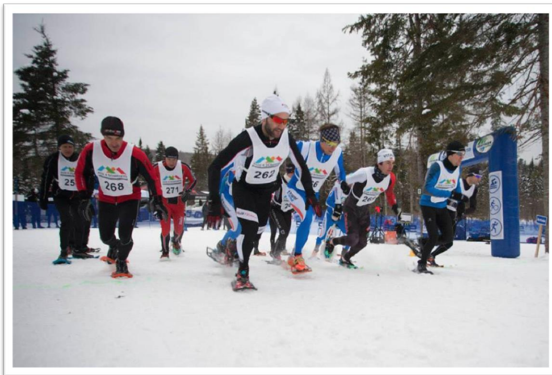
Départ Coupe des neiges – Aux 4 Sommets